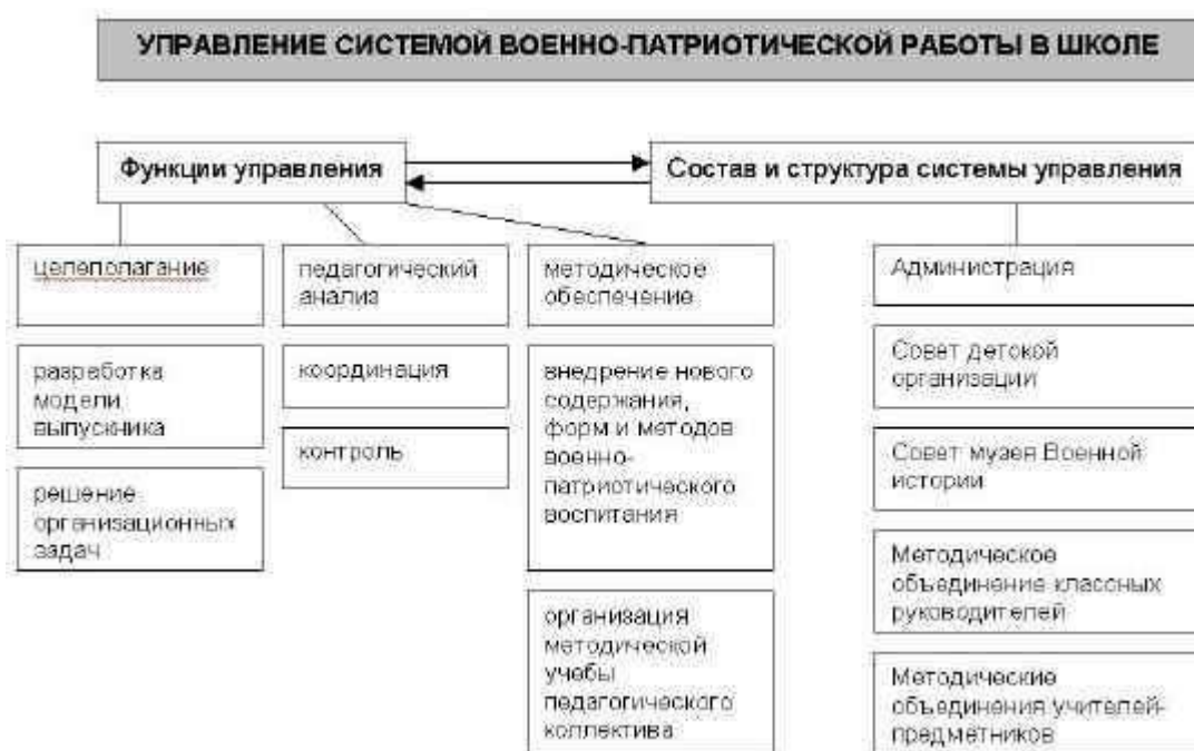
Рисунок 2. Управление системой военно-патриотической работы в школе

воспитания, так и изменениями, происходящими в экономической, политической, социальной и других сферах российского общества, а также новыми условиями современного мира, что обуславливает гибкость в управлении системой военно-патриотического воспитания в школе (рис. 2).